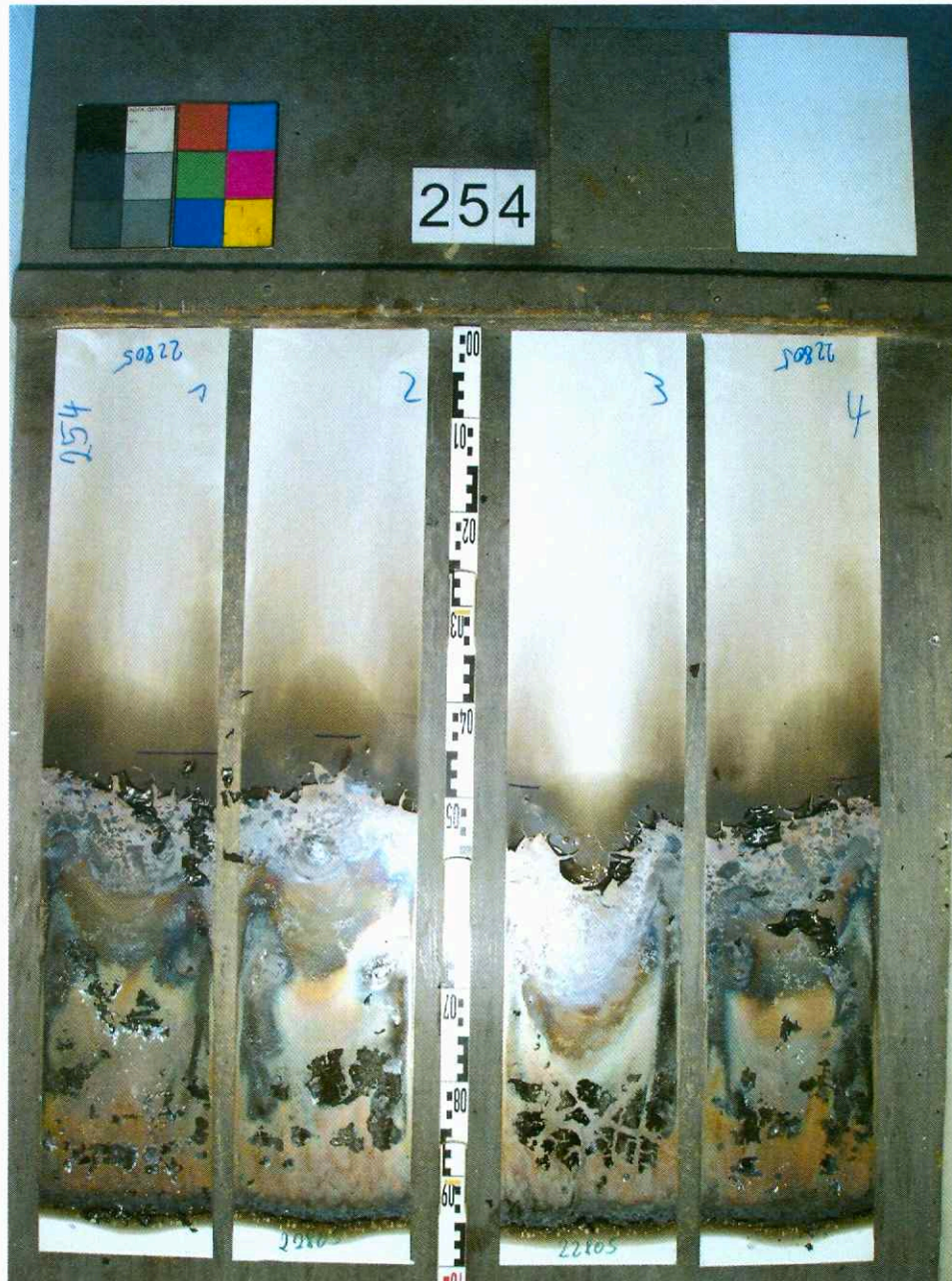
Bild 1 : Aussehen des Probekörpers A nach dem Brandschachtversuch